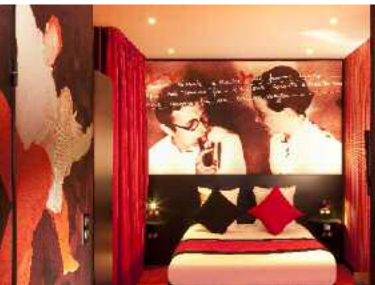
JEAN-PAUL SARTRE & SIMONE DE BEAUVOIR LA LIBERTÉ DU PACTE DE LA POLY-FIDÉLITÉ