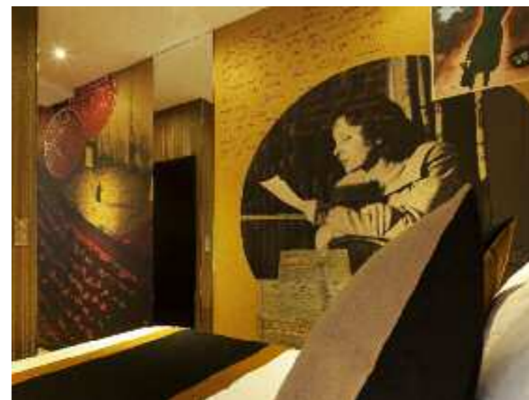
EDITH PIAF & MARCEL CERDAN UNE PASSION EXACERBÉE PAR L'ABSENCE DE L'AUTRE

JEAN-PAUL SARTRE (1905-1980) & SIMONE DE BEAUVOIR (1908-1986)