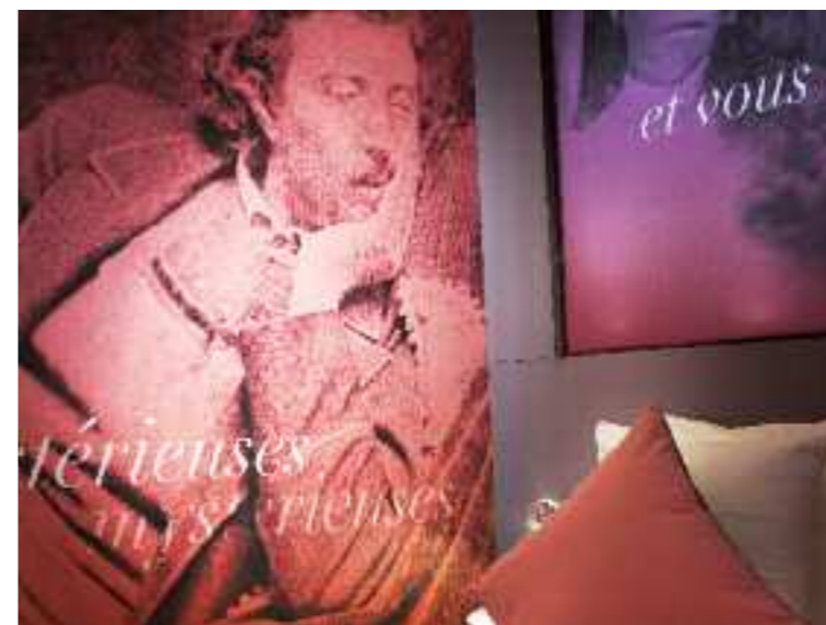
PAUL GAUGUIN & TEHURA UN AMOUR BIENVEILLANT

CHARLES BAUDELAIRE (1821-1867) & JEANNE DUVAL