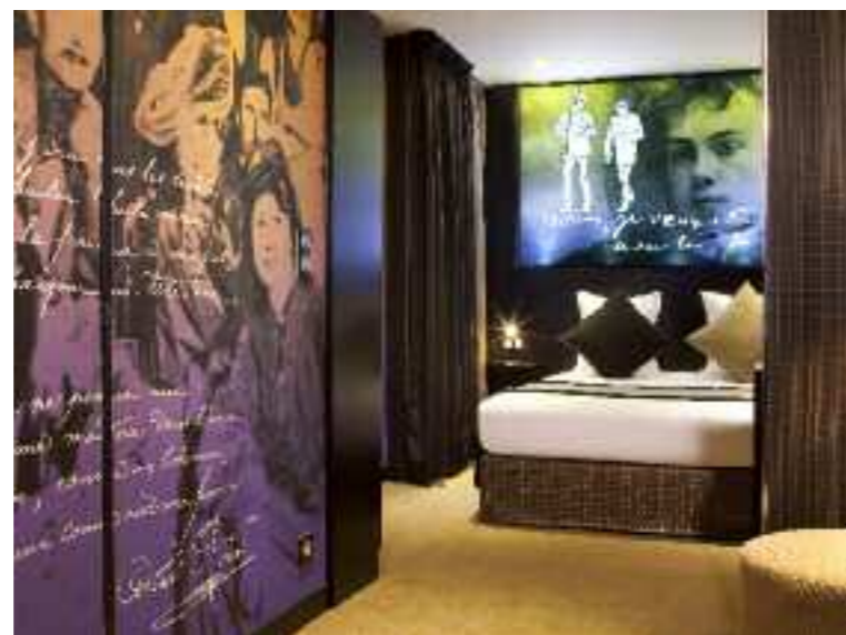
PAUL VERLAINE & ARTHUR RIMBAUD UN AMOUR INTERDIT ET DESTRUCTEUR