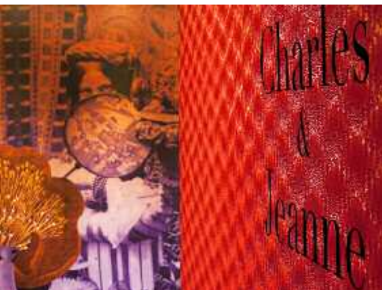
CHARLES BAUDELAIRE & JEANNE DUVAL UNE LIAISON TEMPÉTUEUSE FAITE DE VOLUPTÉ ET DE FÉROCITÉ