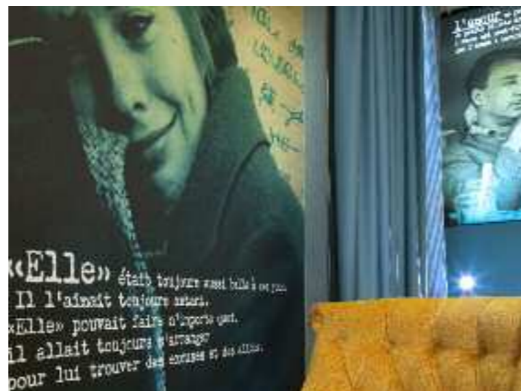
ROMAIN GARY & JEAN SEBERG LE COUP DE Foudre