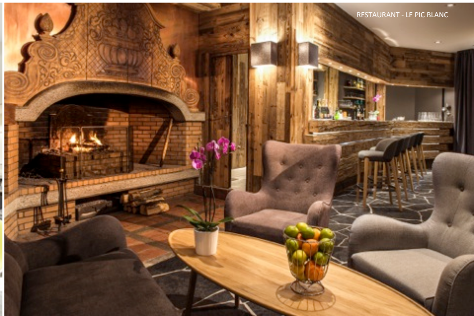
RESTAURANT - LE PIC BLANC