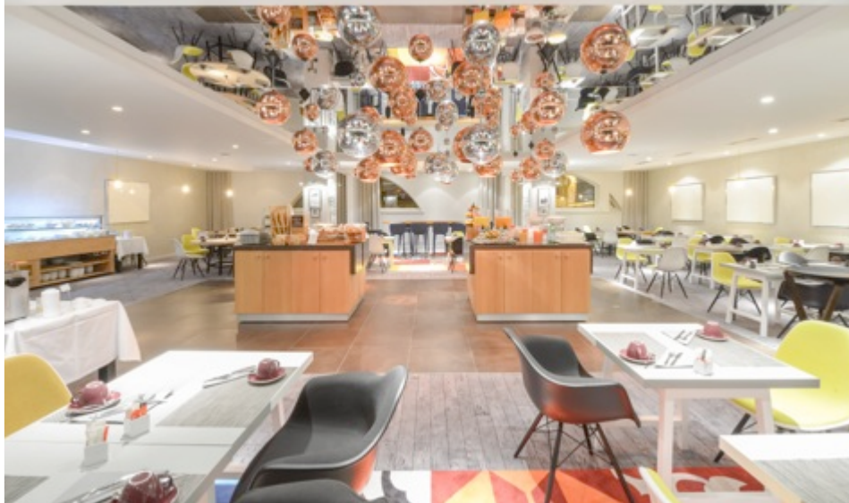
RESTAURANT - AIGLE DES NEIGES