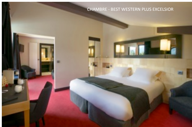
CHAMBRE - BEST WESTERN PLUS EXCELSIOR