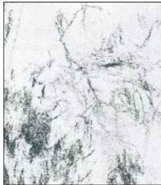
« Portrait de Léonard de Vinci », Vincent van Gogh, détail lettre B12, Arles 1888.

Saviez-vous que le Japon était tenait une forte place dans la vie du peintre et dessinateur néerlandais Vincent VAN GOGH ? L'intéressé déclarait même, de son temps : « Si nous étudions l'art japonais, nous voyons un homme sage et philosophe et intelligent... N'est-ce pas presque une vraie religion que nous enseignent ces Japonais si simples et qui vivent dans la nature comme si eux, Hokusai, Mont Fuji mêmes étaient des fleurs ? ». Jusqu'au 20 avril, le Mercure Brides-les-Bains Grand Hôtel des Thermes accueille une exposition regroupant près d'une centaine d'œuvres dédiées au peintre-poète Vincent VAN GOGH ainsi qu'aux estampes japonaises. Le célèbre hôtel bridois dévoile, à cette occasion, de superbes œuvres sur papier du pionnier de l'impressionnisme, du fauvisme et de l'expressionnisme. Une sélection